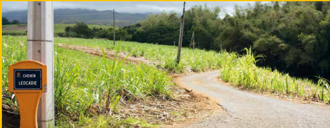
Les travaux d'extension du réseau situé chemin Léocadie à Bourbier-les-Hauts sont désormais achevés.