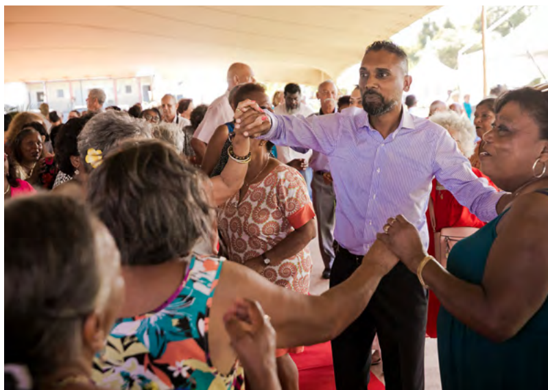
REPAS DES SENIORS - ANIMATION MUSICALE • 05 DÉCEMBRE 2023 •