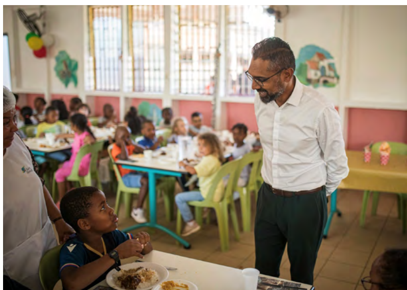
VISITE À L'ÉCOLE ODILE ELIE À L'OCCASION DU REPAS DE NOËL • 14 DÉCEMBRE 2023 •