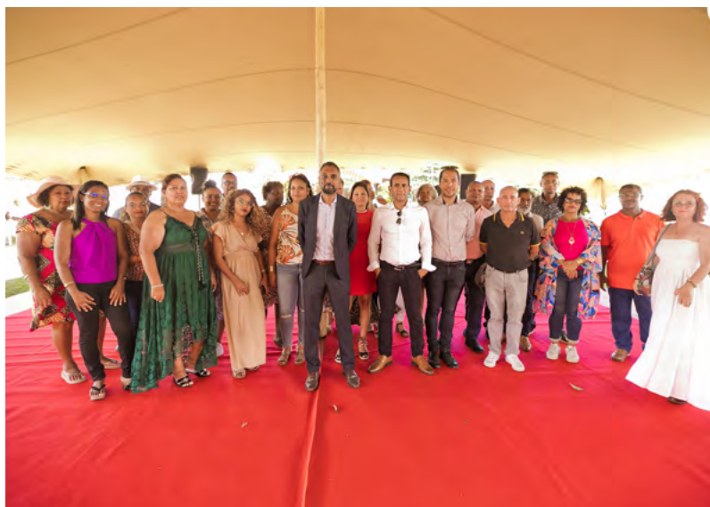
REPAS DES SENIORS - ÉQUIPE DU CCAS • 05 DÉCEMBRE 2023 •