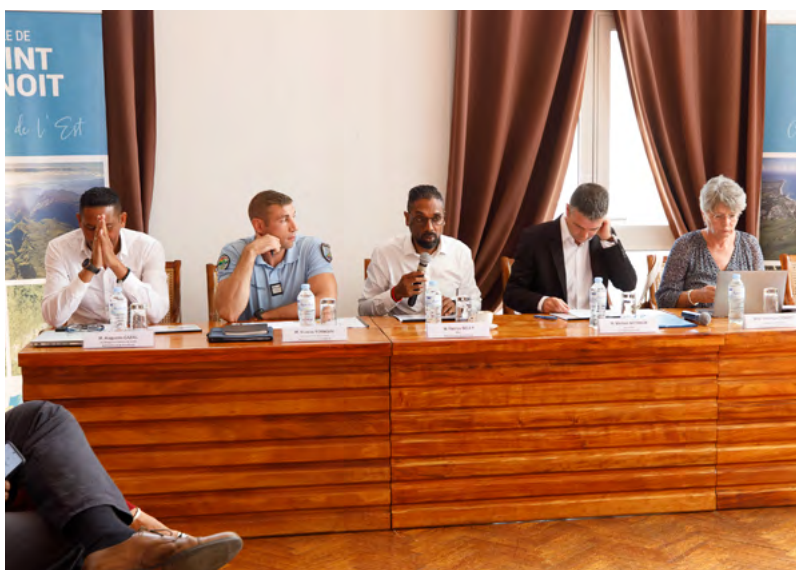
SÉANCE PLÉNIÈRE DU CLSPD : BILAN ET PERSPECTIVES 2024 POUR LA SÉCURITÉ DES BÉNÉDICTIN(E)S • 14 DÉCEMBRE 2023 •