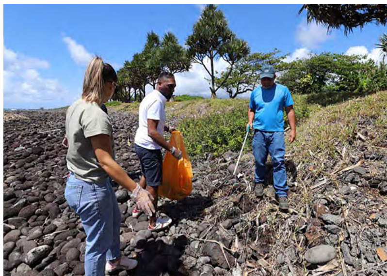
WORLD CLEAN UP DAY SUR LE LITTORAL BÉNÉDICTIN • 8 OCTOBRE 2023 •