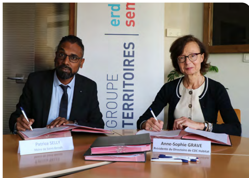
BUDGET COMMUNAL À L'ÉQUILIBRE GRÂCE À LA VENTE DES ACTIFS À LA SEMAC. • 20 SEPTEMBRE 2023 •