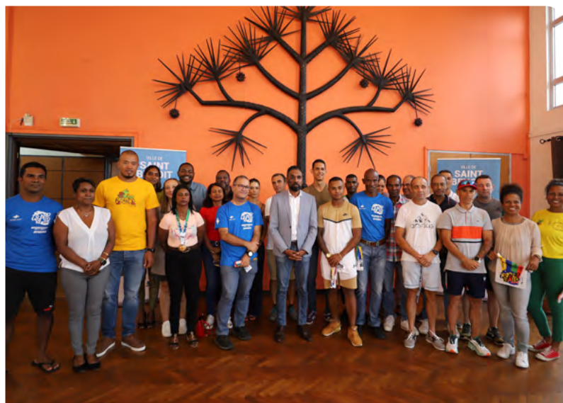
RÉCEPTION DES RAIDEURS BÉNÉDICTINS • 08 NOVEMBRE 2023 •