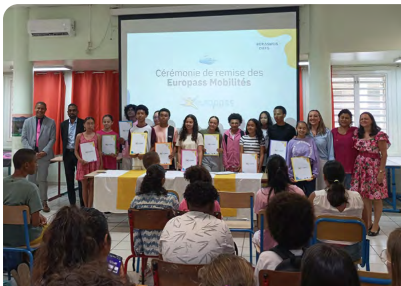
LES ÉLÈVES BÉNÉDICTINS REÇOIVENT LEUR EUROPASS MOBILITÉ • 12 OCTOBRE 2023 •