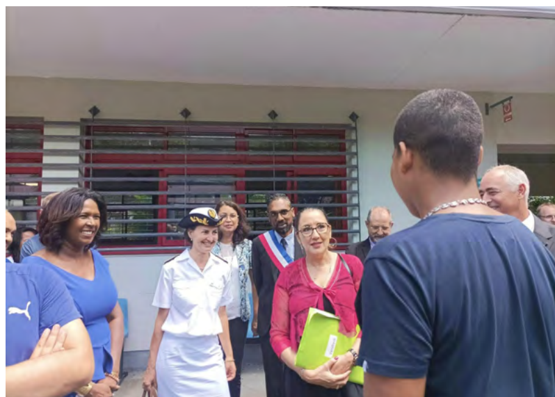
ACCUEIL DE LA MINISTRE DÉLÉGUÉE CHARGÉE DES PERSONNES HANDICAPÉS FADILA KHATTABI AU LYCÉE NELSON MANDELA À BRAS-FUSIL • 10 NOVEMBRE 2023 •