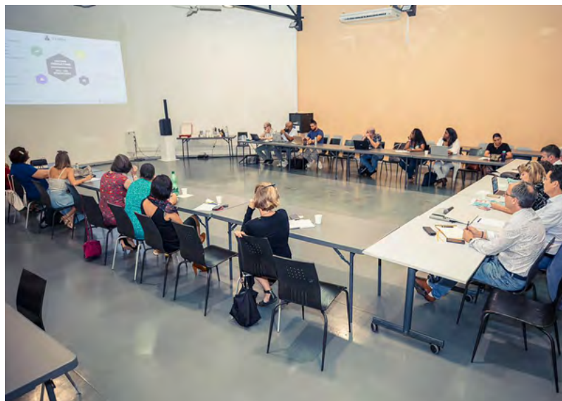
REVUE DE PROJET DE LA CITÉ ÉDUCATIVE DE SAINT-BENOÎT • 8 DÉCEMBRE 2023 •