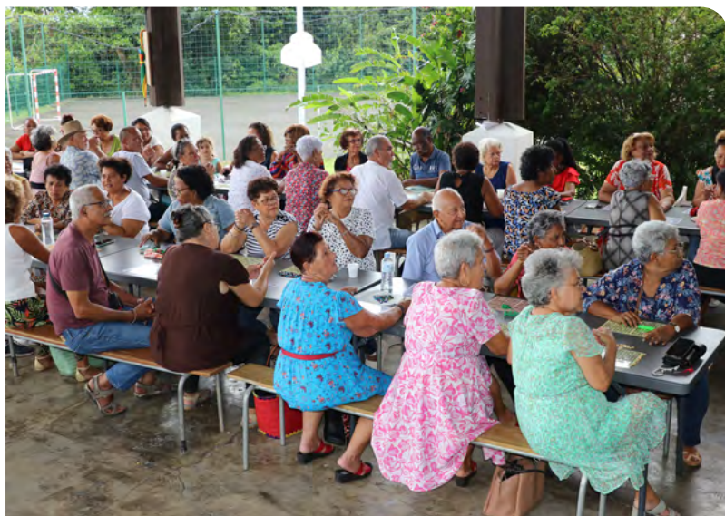
LOTO QUINE SOLIDAIRE DU CCAS • 09 OCTOBRE 2023 •