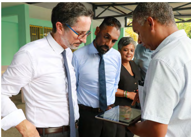
VISITE DE TERRAIN DU PRÉFET DE LA RÉUNION À SAINT-BENOÎT • 02 NOVEMBRE 2023 •