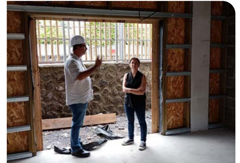
VISITE DU CHANTIER DE L'ÉCOLE DENISE SALAÏ : LIVRAISON PRÉVUE POUR OCTOBRE 2023 • JEUDI 16 MARS •