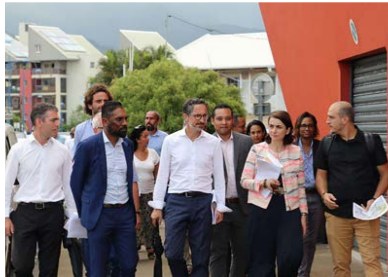
VISITE DE LA DIRECTRICE GÉNÉRALE DE L'AGENCE NATIONALE POUR LA RÉNOVATION URBAINE (ANRU) • LUNDI 30 JANVIER •