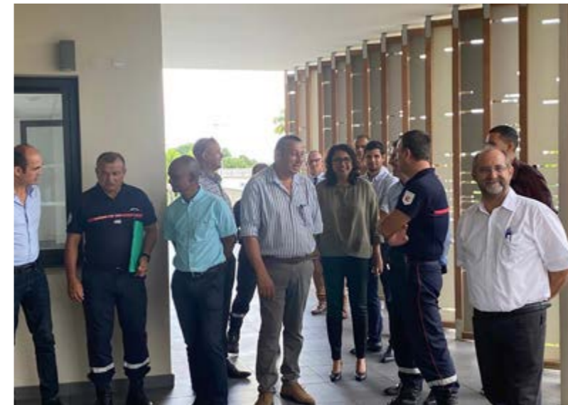
VISITE DU NOUVEAU CENTRE D'INCENDIE ET DE SECOURS DE SAINT-BENOÎT • MERCREDI 05 AVRIL •