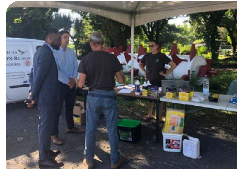
CAMPAGNE DE DÉRATISATION DE LA FDGDON ET VENTE DE KITS À MOITIÉ PRIX GRÂCE À LA PARTICIPATION DE LA COMMUNE • JEUDI 27 MAI •