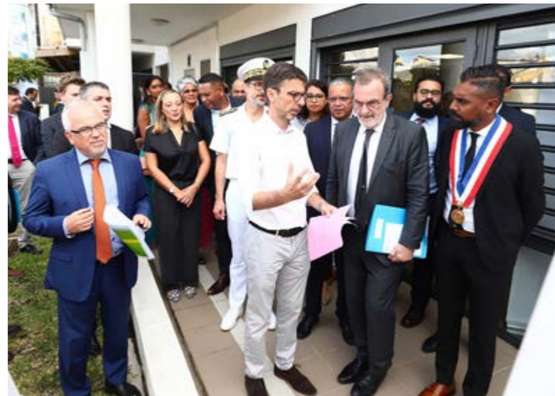
VISITE DU MINISTRE CHARGÉ DES OUTRE-MER JEAN-FRANÇOIS CARENCO POUR UNE SÉQUENCE SUR LE LOGEMENT • SAMEDI 18 FÉVRIER •