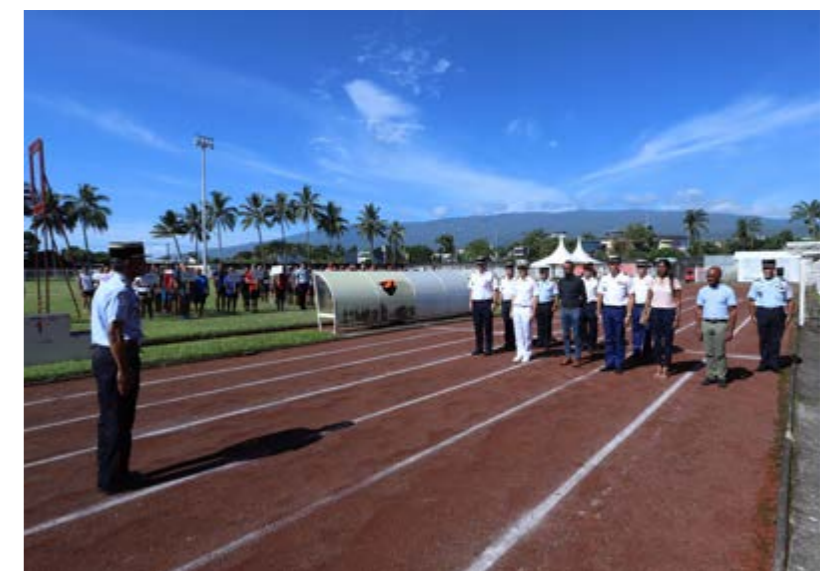
LANCEMENT DU PARCOURS SPORTIF DES SAPEURS-POMPIERS • SAMEDI 22 AVRIL •