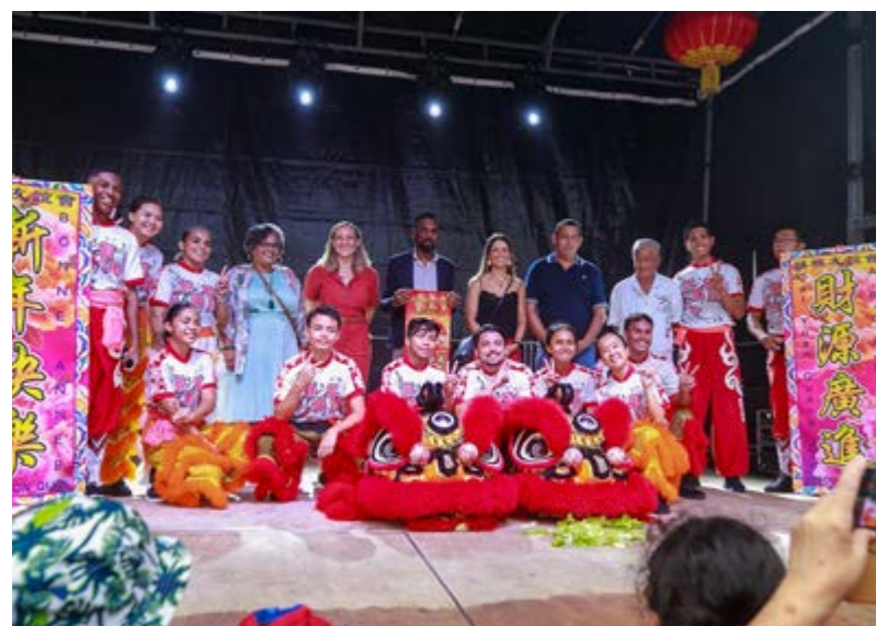
LA COMMUNAUTÉ CHINOISE CÉLÈBRE L'ANNÉE DU LAPIN D'EAU : XIN NIAN KUAI LE ! • SAMEDI 04 FÉVRIER •