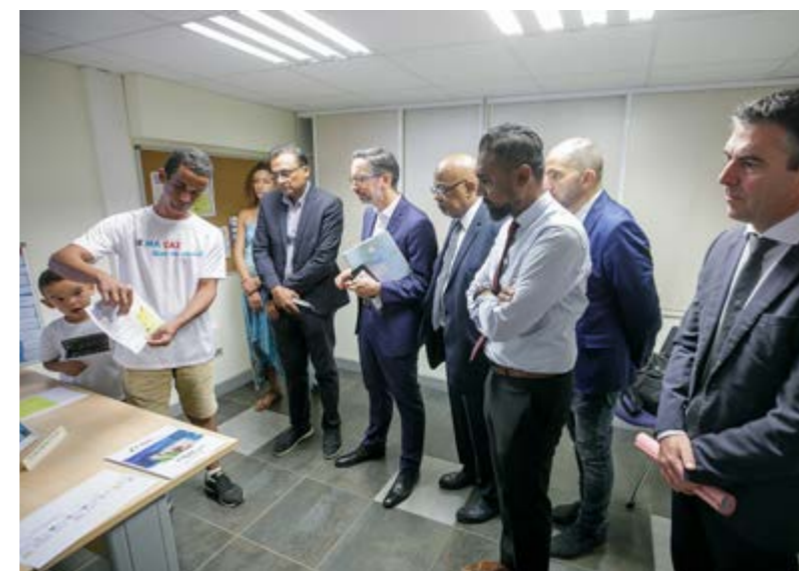
MATINÉE CONSACRÉE À L'HABITAT INCLUSIF DANS LE CADRE DE LA DATE D'ANNIVERSAIRE DE LA LOI SUR LE HANDICAP • SAMEDI 11 FÉVRIER •