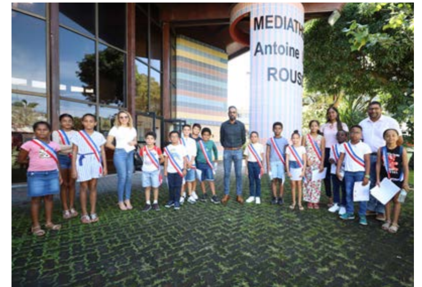
SÉANCE DE TRAVAIL DU CONSEIL MUNICIPAL DES ENFANTS • SAMEDI 22 AVRIL •