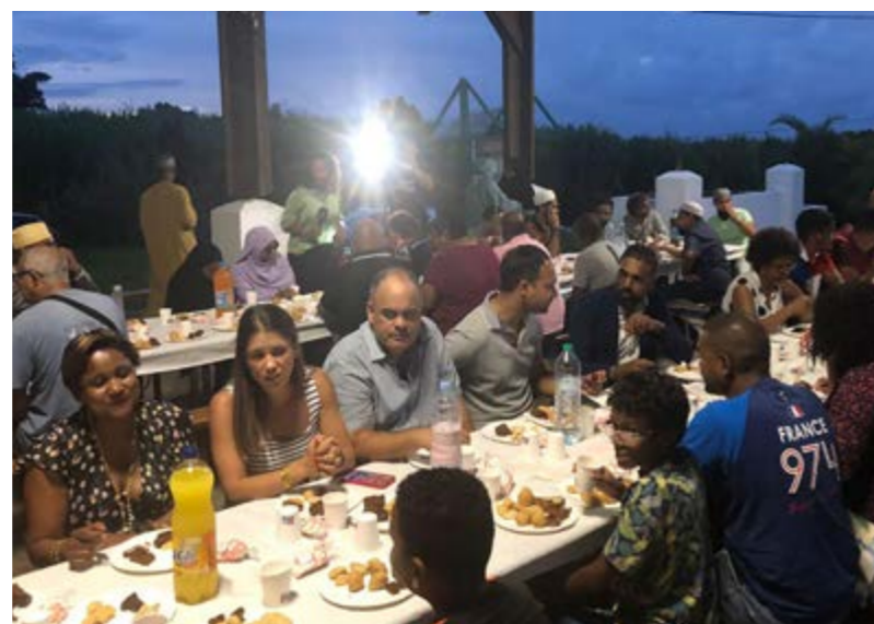
IFTAR PARTAGÉ À L'OCCASION DE LA RUPTURE DU JEUNE • MOIS D'AVRIL •