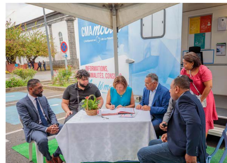
VISITE DE PROXIMITÉ DES PRÉSIDENTS DE LA CCIR ET DE LA CHAMBRE DES MÉTIERS