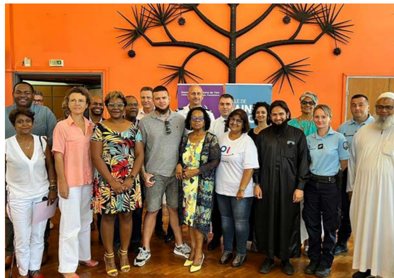
JOURNÉE DE LUTTE CONTRE LES VIOLENCES FAITES AUX FEMMES • 25 NOVEMBRE •