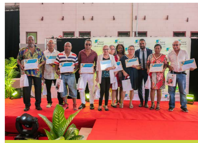
RETRAITÉS COMMUNAUX 2022 • 7 DÉCEMBRE •