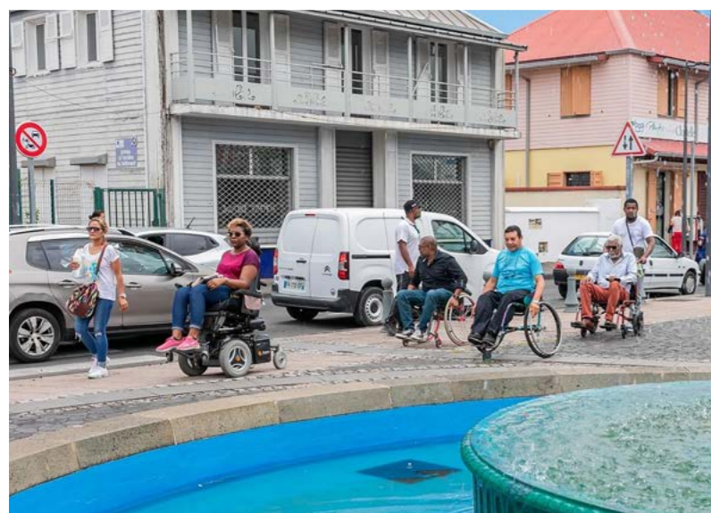
MISE EN SITUATION DE HANDICAP DANS LE CENTRE-VILLE • SAMEDI 03 DÉCEMBRE •