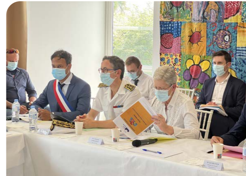
VISITE DE LA MINISTRE CHARGÉE DES PERSONNES HANDICAPÉES GENEVIÈVE DARRIEUSSECQ • 15 DÉCEMBRE •