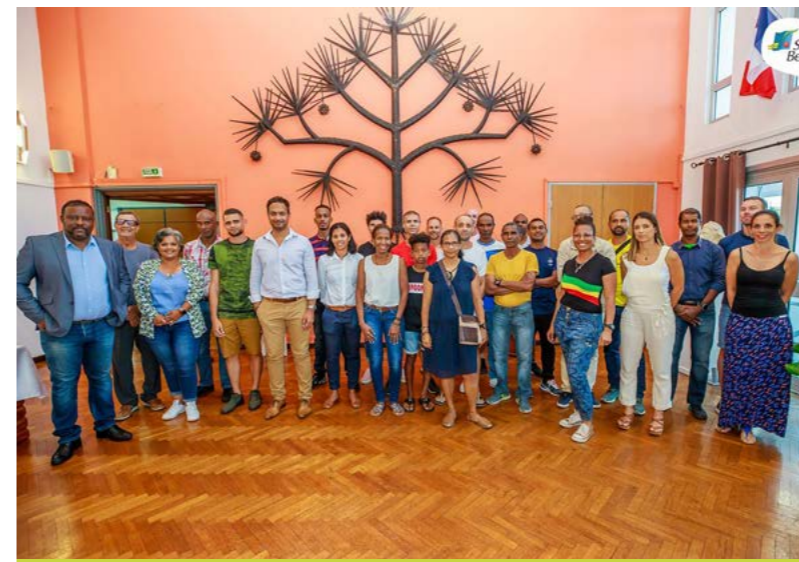
RÉCEPTION EN L'HONNEUR DES PARTICIPANTS AU GRAND RAID 2022 • 16 OCTOBRE •