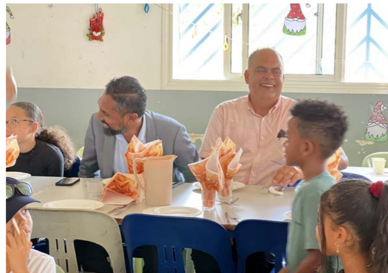
REPAS DE NOËL DANS LES ÉCOLES • 15 DÉCEMBRE •