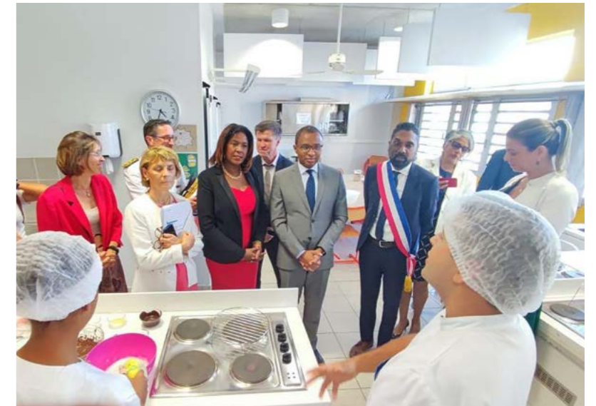
CAMPUS DES MÉTIERS ACCUEIL DU MINISTRE PAP NDIAYE AU LYCÉE MARIE CURIE