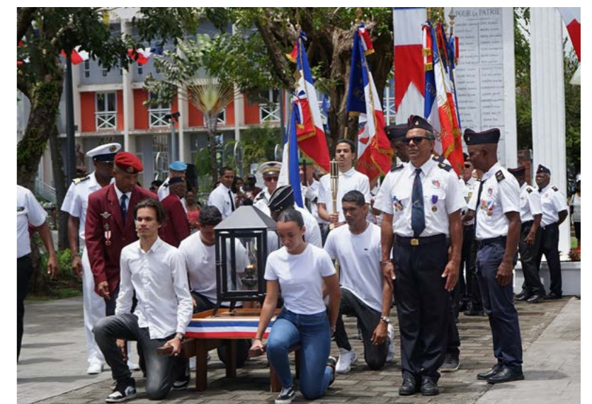
ACCUEIL DE LA FLAMME DU SOLDAT INCONNU • 3 NOVEMBRE •