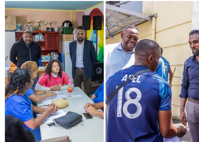
VISITES DE PROXIMITÉ À BRAS-FUSIL ET LABOURDONNAIS • OCTOBRE/NOVEMBRE •