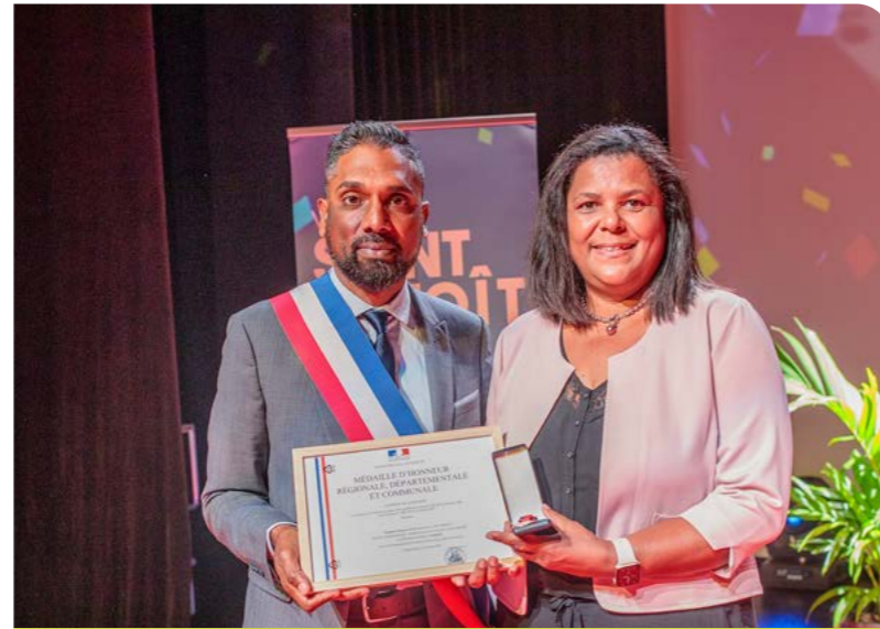
REMISE DES MEDAILLES AUX AGENTS APRES 20, 30 OU 35 ANNÉES DE SERVICE ! • 26 AOÛT •