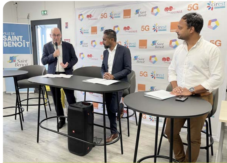
LANCEMENT DE LA 5G À ST-BENOÎT • 8 DÉCEMBRE •