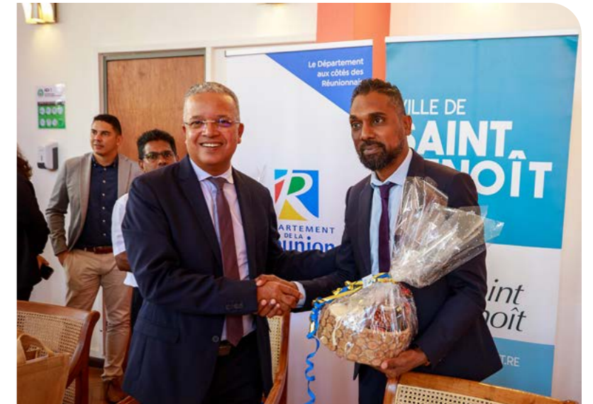
VISITE DU PRÉSIDENT DU DÉPARTEMENT CYRILLE MELCHIOR DANS LE CADRE DU PACTE DE SOLIDARITÉ TERRITORIAL (PST)