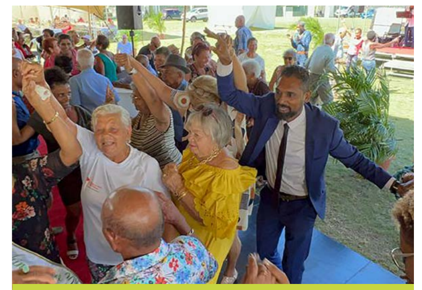
DÉJEUNER DES SENIORS • 14 DÉCEMBRE •