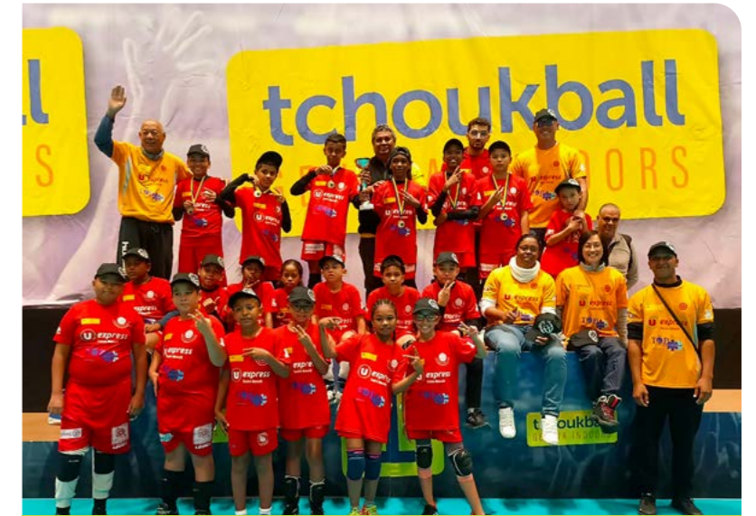
L'ABCC TCHOUKBALL - CHAMPIONNE DU MONDE • 7 DÉCEMBRE •