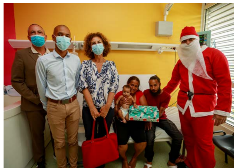
REMISE DE CADEAUX AUX ENFANTS HOSPITALISÉS AU GHER • 22 DÉCEMBRE •