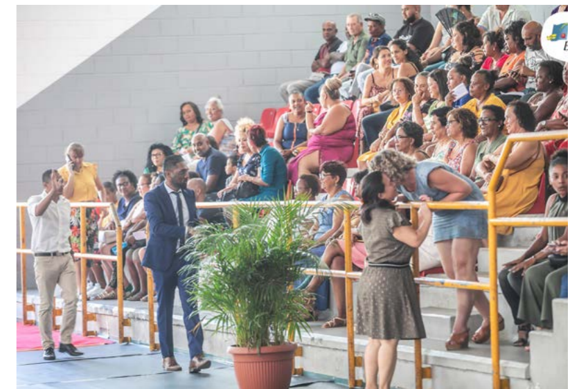
RÉCEPTION EN L'HONNEUR DES AGENTS • 7 DÉCEMBRE •